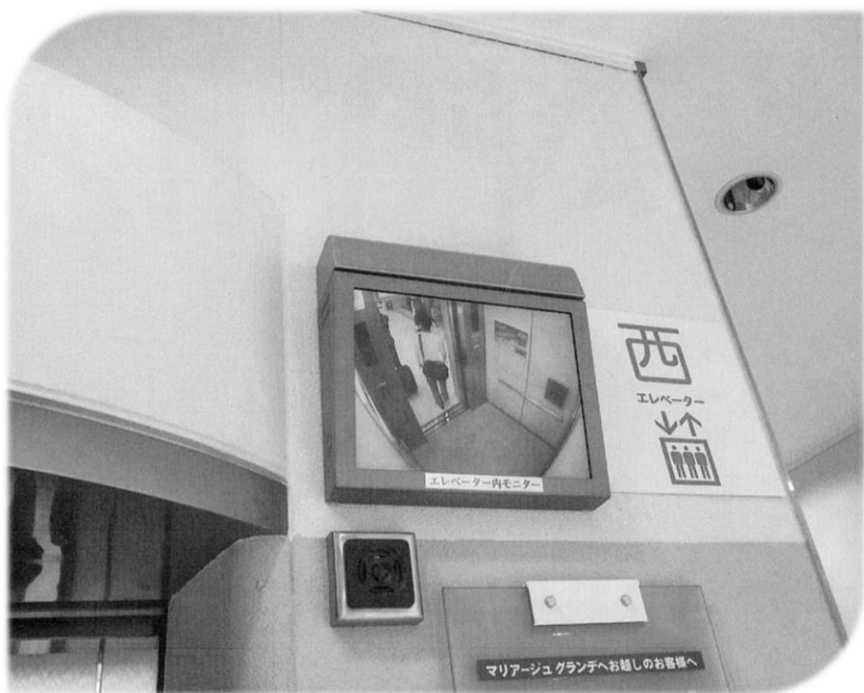
『自然と人間』2016年12月号より